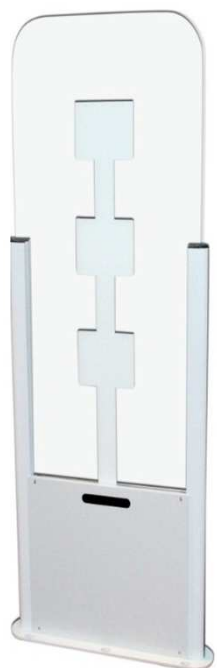
无障碍式远距离通道门禁(可选)