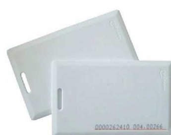
接触式或者非接触式RFID卡