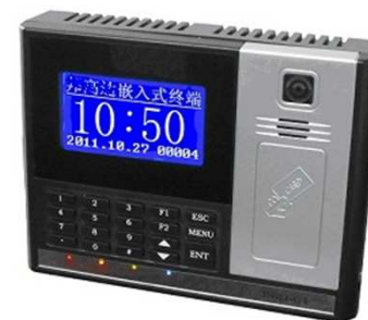
接触式读写设备(可选)