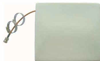
定向超高频RFID读写设备